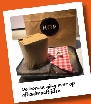
De horeca ging over op afhaalmaaltijden