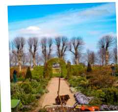
Werken op veilige afstand