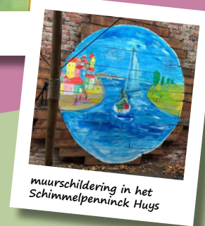
muurschildering in het Schimmelpenninck Huys