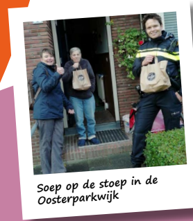
Soep op de stoep in de Oosterparkwijk

Door het hele jaar open te blijven, hebben we voor velen het verschil gemaakt. Voor onze deelnemers, zodat eenzaamheid of terugval kon worden voorkomen. Voor onze klanten, die een maaltijd konden afhalen of doneren of hun nog bruikbare spullen konden opruimen. Voor onszelf, omdat we zijn bevestigd in onze betekenis en al doende veel hebben geleerd. Bijvoorbeeld door digitale en online mogelijkheden te benutten voor onze sociale ondernemingen en activiteiten.